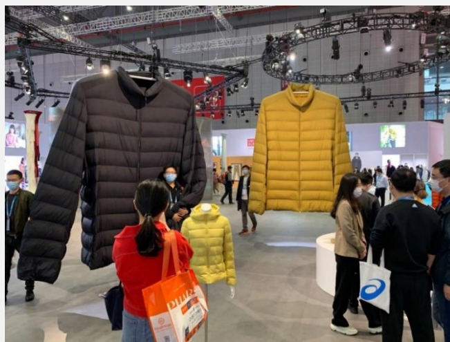
フレンドリージャパン上海 周