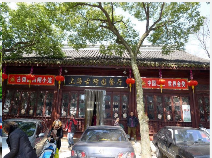
フレンドリージャパン上海 周